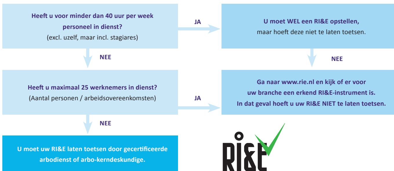
Figuur 1 - Stroomschema RI&E

de RI&E Bouwnijverheid van de website van Volandis. Als u meer dan 25 werknemers in dienst heeft, dan moet u uw RI&E laten toetsen door een arbo-kerndeskundige (zoals een veiligheidskundige of arbeidshygiënist). Of u RI&E plichtig bent en/of u uw RI&E moet laten toetsen kunt u checken met behulp van het onderstaand stroomschema van figuur 1.