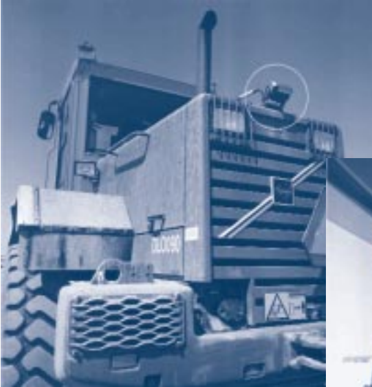
Camera achter op machine