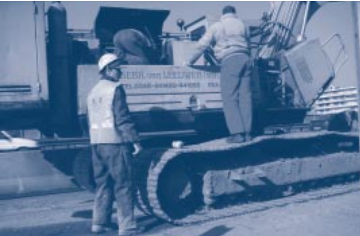
Onderhoud: vervangen van oliefilter

Veilig werken met grondverzetmachines hangt nauw samen met de onderhoudstoestand van het materieel. Het is daarom van groot belang tijdig onderhoud uit te voeren. In het instructieboek staat de informatie die nodig is om de onderhoudswerkzaamheden vakkundig uit te voeren. Voor bepaalde reparaties zijn specialisten nodig.