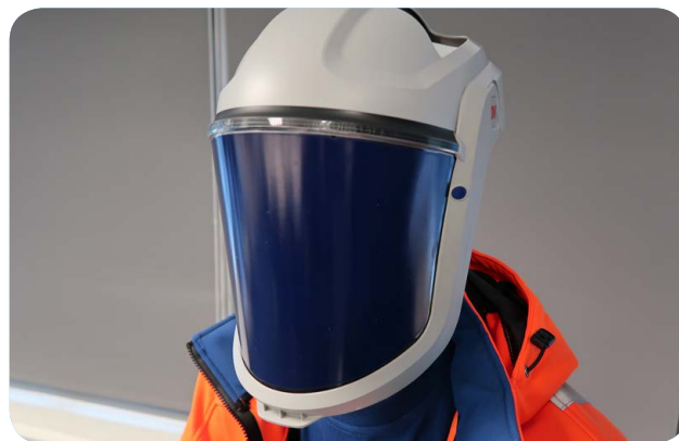
Afbeelding 3 - Volgelaatmasker met aangeblazen gefilterde lucht.

Bij dit type ABM wordt de lucht met een op batterijen werkende ventilator door de filter gevoerd. De gebruiker kan daardoor de gefilterde lucht inademen zonder dat hij zelf de lucht door de filter hoeft te zuigen. Ook ontstaat er overdruk, waardoor vuile lucht minder snel achter het masker 'lekt'. Deze middelen zijn er in combinatie met een half- of volgelaatmasker, met een helm, met een gelaatsscherm of met een kap.