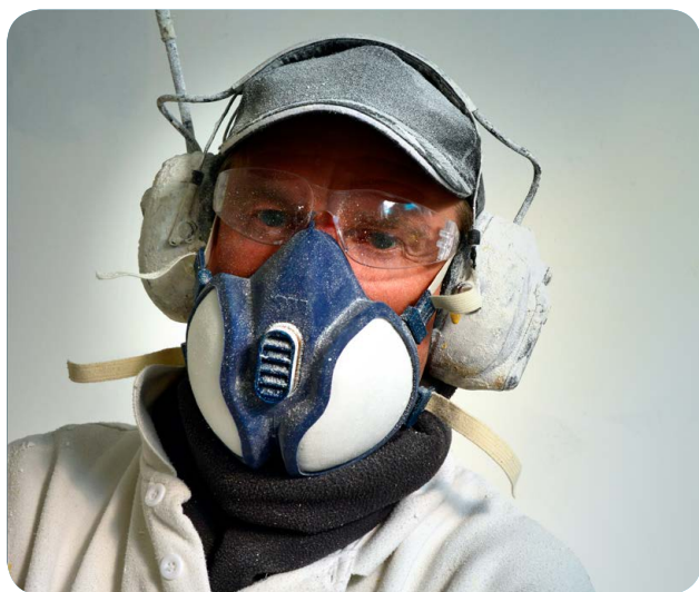
Afbeelding 6 - Beschermingsmiddelen dienen goed op elkaar te zijn afgestemd.

De grenswaarde geldt alleen voor blootstelling aan de zuivere stof en is niet zonder meer van toepassing op een bestanddeel van een mengsel van stoffen. Het is zelfs mogelijk dat bij de blootstelling aan een mengsel van verschillende stoffen, de schadelijke effecten van de afzonderlijke stoffen aanzienlijk worden versterkt. Vraag ook hiervoor advies bij een gecertificeerd arbeidshygiënist (bijvoorbeeld via je arbodienst).