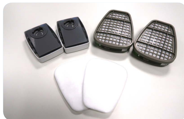
Afbeelding 4 - De keuze van een goed filter is belangrijk.

Om de inademweerstand te verminderen, leveren sommige leveranciers (P3-)filters met een extra groot oppervlak of wordt het masker voorzien van een extra filterpatroon.