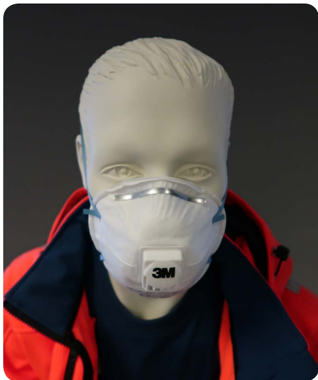
Afbeelding 1 - ABM voor éénmalig gebruik bestaan grotendeels uit filtermateriaal.

Bij ABM voor éénmalig gebruik (zoals het snuitje) bestaat het masker geheel of grotendeels uit filtermateriaal. Dit type stofmaskers krijgt de code FFP (Filtering Face Piece). Als is vastgesteld dat de gebruiksduur is verstreken, wordt het masker weggegooid. De maskers bedekken de neus, de mond en de kin. Soms heeft dit type ABM een kunststof rand om lekkage langs de randen te beperken.