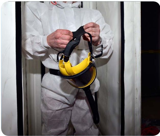
Afbeelding 7 - Kies bij zwaar werk een ABM met toevoer van schone lucht via een slang.

Bij zwaar werk wordt zoveel lucht ingeademd dat bij ABM met aangedreven gefilterde lucht de ventilator te weinig lucht levert. Daardoor kan verontreinigde lucht naar binnendringen. Een helm of een kap met aangedreven gefilterde lucht bieden dan onvoldoende bescherming. Een masker met aangedreven gefilterde lucht kan dan wel worden gebruikt. Een betere oplossing voor zwaar werk is een ABM waarbij de hoeveelheid toegevoerde lucht wordt afgestemd op het luchtverbruik van de gebruiker.