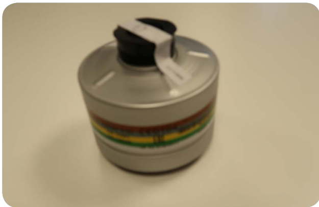
Afbeelding 5 - Kies het juiste gasfiltertype.

Een gas of damp kan worden afgevangen met een gasfilter. Een gasfilter beschermt niet gelijktijdig ook tegen stofdeeltjes, tenzij de gasfilter is gecombineerd met een deeltjesfilter. Er zijn verschillende soorten gas- filters. Deze zijn afgestemd op een bepaald type gas waar tegen ze bescherming bieden. Het type gasfilter kun je herkennen aan de letter- en de kleurcode (zie tabel 1). Sommige leveranciers leveren combinatiefilters die tegen meerdere gassen bescherming bieden.