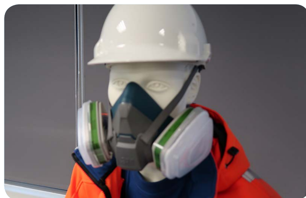
Afbeelding 2 - Halfmasker met verwisselbare filters.

In de rest van dit document wordt het kwartmasker niet meer genoemd, omdat deze zeer weinig wordt toegepast.