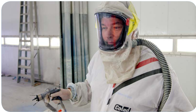
Afbeelding 9 Aangedreven kap, waarbij ventilator en filter in de kap zijn geïntegreerd

naar binnen wordt getrokken. Maskers, helmen en kappen met aangedreven gefilterde lucht zijn dus veiliger en ook comfortabeler dan onderdrukmaskers.