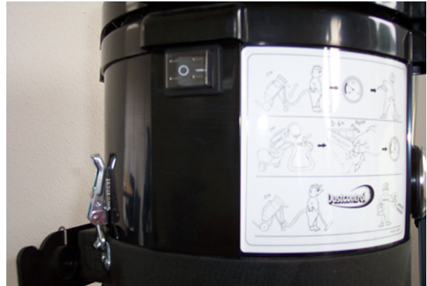
Schakelaars kunnen het beste stofdicht zijn uitgevoerd.

In bijlage 2 staan in de vorm van een checklist de aandachtspunten samengevat die van belang zijn bij de aanschaf van een stofzuiger.