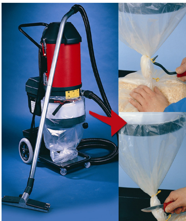
Een afsluitbare stofzak helpt blootstelling aan stof te voorkomen

Bij het legen van de stofzuiger kan ook veel stof vrijkomen. De stofzak moet daarom gemakkelijk stofvrij verwijderd kunnen worden.