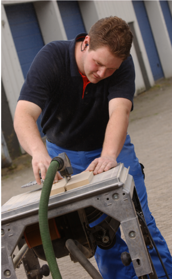
Cirkelzaag met boven- en onderafzuiging

Kwetsbare delen van de machine moeten van de verontreinigde luchtstroom worden afgeschermd. Stof in kwetsbare delen van de machine verkort de levensduur; daarbij komt het stof bij het schoonmaken weer vrij.