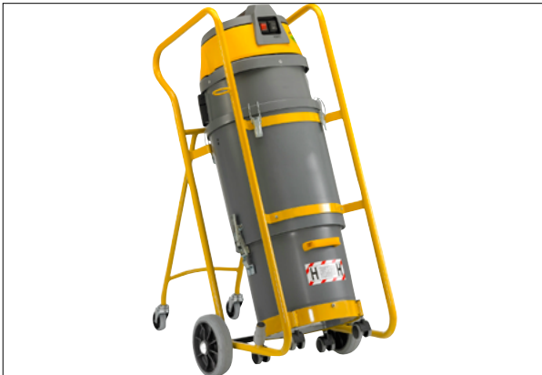
Een mobiele stofzuiger

Het eerste systeem is in de Nederlandse bouwnijverheid (nog) niet gangbaar en wordt hier daarom niet verder besproken. De informatie in deze paragraaf heeft dus betrekking op mobiele stofzuigers.