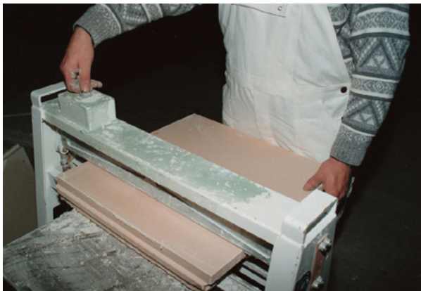
Positief bijeffect: het knippen van gipsblokken geeft minder stof én maakt minder lawaai dan het zagen van gipsblokken

Bij een aantal genoemde stofbeperkende maatregelen, is de blootstelling aan stof bij een blootstellingduur van zes uur per dag toch nog te hoog. Deze maatregelen zijn dus niet afdoende, want arbeidsomstandighedenbeleid behoort ervan uit te gaan dat iemand zijn werk gedurende een hele dag normaal kan doen. Maar de keuze van maatregelen wordt door vele factoren bepaald. Is er op een werkplek bijvoorbeeld geen stromend water aanwezig, dan kan beter voor afzuiging