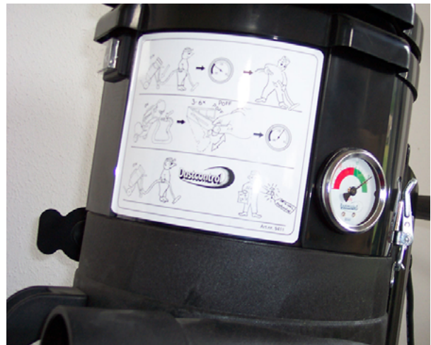
De onderdrukmeter geeft aan wanneer het filter gereinigd moet worden

Los van de zaken die op het oog kunnen worden beoordeeld en die zijn toegelicht in de voorgaande paragraaf, zijn er ook zaken die niet op het oog kunnen worden beoordeeld. Het is zinvol om daarover specificaties bij diverse leveranciers op te vragen en deze met elkaar te vergelijken. Hieronder staat een lijst van specificaties die elke leverancier moet kunnen verstrekken.