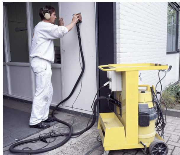
Afzuiging aan de achterzijde geeft doorgaans de minste hinder.

De afzuiging moet met de richting van het zaagblad meewerken. Afzuiging tegen de draairichting van het blad in kost veel extra zuigkracht. Dit heeft als gevolg dat de afzuiging soms bovenop of vooraan het apparaat zit. Afzuiging op dergelijke plaatsen maakt dat door het draaien van het apparaat de slang gaat krullen en mogelijk losschiet. Een draaihulsaansluiting kan dat voorkomen.