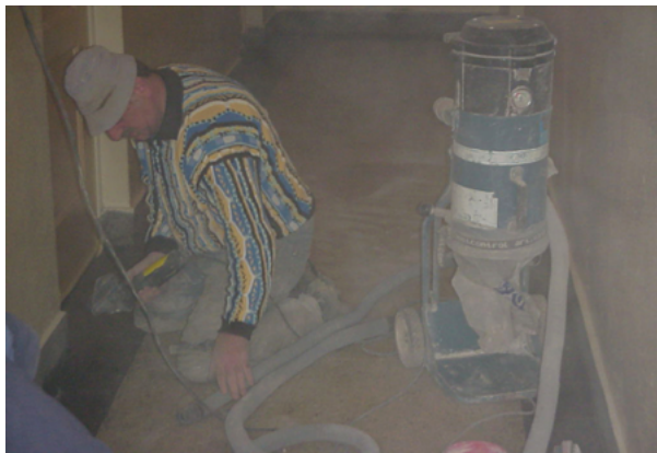
Schuif aansluitingen kunnen gemakkelijk losschieten

Een te nauwe slang raakt snel verstopt, vooral bij 'plakkerig' stof zoals gipsstof. Een te dikke slang vraagt extra motorcapaciteit (en dus meer gewicht) om de benodigde luchtsnelheid in de slang te halen. Bij voorkeur hebben de slangen een diameter van minimaal 35 mm en geen vernauwingen.