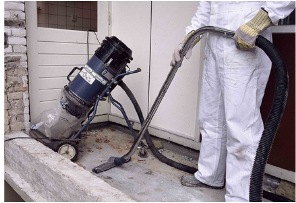
Stof moet zo snel mogelijk worden opgeruimd

worden gekozen dan helemaal niets te doen. Wel zal in dat geval de duur van de blootstelling moeten worden beperkt. Dit kan bijvoorbeeld door werkzaamheden waarbij stof ontstaat af te wisselen met werk waarbij dat niet gebeurt. Voor situaties waarin de blootstelling aan stof nog te hoog is, zijn in de tabellen in bijlage 1 bij benadering maximale blootstellingstijden aangegeven. Als deze tijden worden overschreden, zal alsnog ademhalingsbescherming moeten worden gedragen. Welke bescherming dan van toepassing is, vindt u in ons Arbouw-advies: "Ademhalingsbescherming".