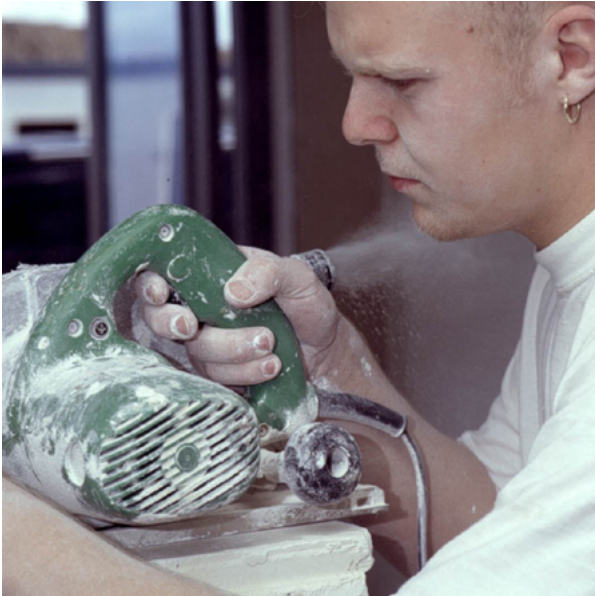
Stof kan vrijkomen bij allerlei bewerkingen van bouwmaterialen. Wanneer stof niet wordt afgezogen, is het dragen van ademhalingsbescherming noodzakelijk!

In de bouwnijverheid hebben we regelmatig met stof te maken. Stof kan vrijkomen bij allerlei bewerkingen van bouwmaterialen. Veel werknemers in de bouwnijverheid blijken hiervan hinder te ondervinden. Daarom besteedt Arbouw veel aandacht aan stof in de bouw. In deze brochure staan criteria die u kunt hanteren bij de aanschaf van handgereedschap en stofzuigers die de blootstelling aan stof verminderen.