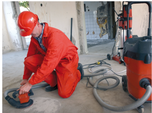
Een goed ontworpen kap omsluit de slijpschijf helemaal.

In bijlage 5 worden de aandachtspunten samengevat die van belang zijn bij de aanschaf van vlakke slijpers.