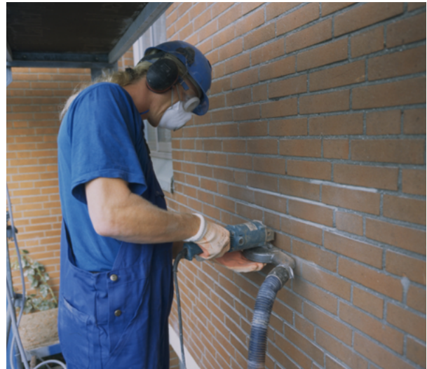
Stof zo dicht mogelijk bij de bron afzuigen

Ook in de afbouwsector komt bij een aantal bewerkingen van materialen stof vrij. Voorbeelden treft u aan in de tabel in bijlage 1. Als uw werknemers hinder ondervinden door stof of als zij het risico lopen dat hun gezondheid door stof wordt aangetast, moeten er maatregelen worden getroffen om de blootstelling aan stof tot een acceptabel niveau te verminderen. Het beste kunt u er natuurlijk voor zorgen dat er zo weinig mogelijk stof ontstaat of dat het stof zo dicht mogelijk bij de bron wordt afgezogen. In deze brochure staan de mogelijkheden daartoe in een aantal tabellen op een rij. Het gaat daarbij voornamelijk om stofafzuiging en natte bewerkingstechnieken in de afbouwsector.