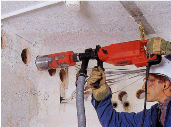
Een kroonboor kan met een afzuighulpstuk worden afgezogen.