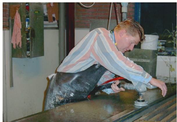
Polijsten met watertoevoer

Helaas kunnen hulpmiddelen voor bestrijding van stof wel eens voor nieuwe problemen zorgen. Als het stof of slib indroogt dat bij natte bewerkingen vrijkomt, is een nieuwe bron van stof gevormd. Het is dus zaak dit stof op te ruimen als het nog nat is. Ook is een aantal apparaten en hulpmiddelen zo zwaar, dat het handmatig vervoeren een gezondheidsrisico oplevert. Verticaal transport van een blokkenknipper moet eigenlijk altijd mechanisch plaatsvinden. En ook sommige stofzuigapparatuur is zo zwaar dat met de hand dragen niet verantwoord is. Anderzijds is het mogelijk dat door invoering van een maatregel een positief bijeffect optreedt. Bijvoorbeeld een lagere geluidsbelasting wanneer gipsblokken geknipt worden in plaats van gezaagd met een cirkelzaag.