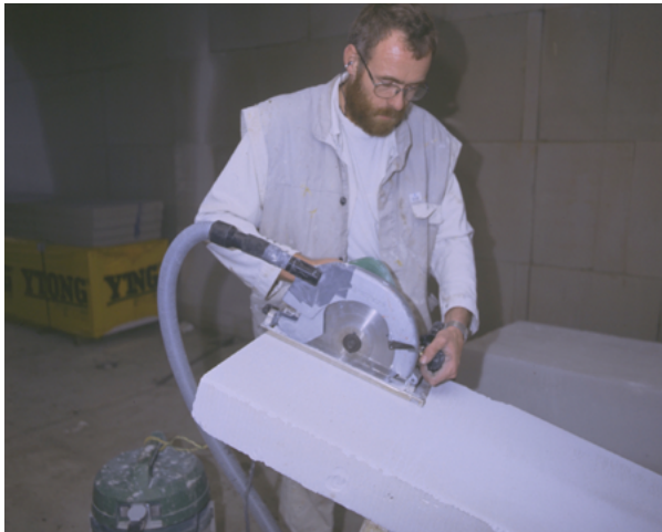
Hulpstukken passen niet altijd goed

Een 'stofzak vol'-indicator helpt te voorkomen dat wordt doorgewerkt met een volle stofzak. De stofzak moet zich gelijkmatig vullen zonder dat er ongebruikte ruimte ontstaat, ook als er grover materiaal wordt opgezogen. De stofzak moet verder uiteraard stevig zijn en ook bij enige overbelasting niet scheuren tijdens het zuigen of bij het uitnemen. Het is verder van belang dat de stofzak kan worden afgesloten zonder dat er veel stof ontsnapt en dat de zak voldoende stofdicht is, of dat het uitgeblazen stof in een nafilter wordt opgevangen.