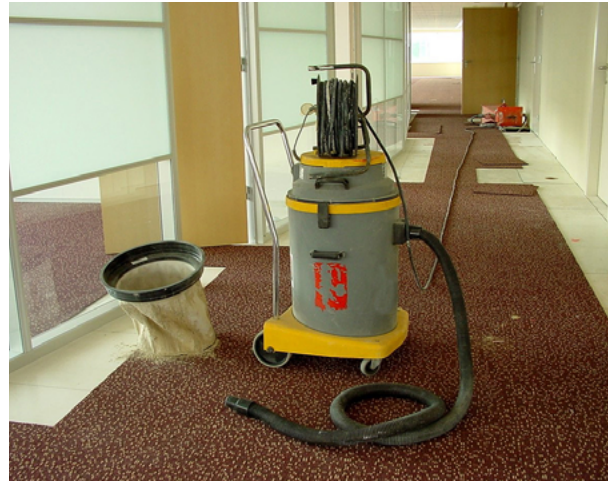
Bij het schoonmaken van de stofzuiger komt ook stof vrij.

Het slijpen van steen kan het beste nat gebeuren. Is dat technisch of organisatorisch niet mogelijk, dan kunnen vlakke slijpmachines worden uitgerust met een kap van relatief zacht materiaal, dat in gelijke mate slijt als de slijpsteen. Op die manier is een goede afdichting zoveel mogelijk gewaarborgd. Er bestaan ook 'verende' kappen met een vergelijkbaar effect. De aansluiting moet zo zijn aangebracht dat de slang niet gaat krullen in het gebruik. Eventueel kan de aansluiting als draaihuls worden uitgevoerd. Kwetsbare delen