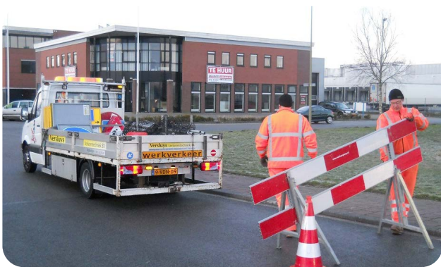
Twee mannen lopen met zwaar materieel/hek

Een aantal knelpunten komt in alle processtappen voor. Deze generieke knelpunten kunnen het beste ondervangen worden door hiervoor aandacht te hebben in de eerste processtap, het voorbereiden van de werkzaamheden.