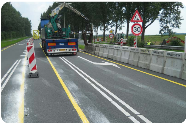
Afbouw wegafzetting op gebiedsontsluitingsweg

2.9.1 geldt voor deze wegcategorie nog het volgende.