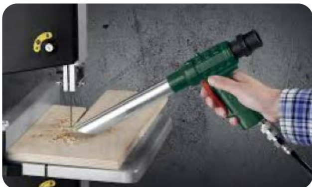
Zuigpistool voor reiniging machines en materiaal