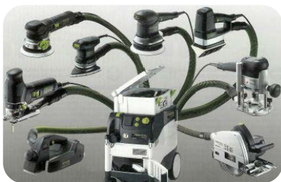
Industriële stofzuiger met aansluiting