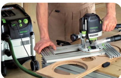
Houtstof afzuiging van een bovenfrees