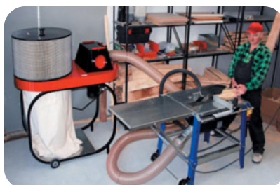
Houtstof afzuiging met voorafscheiding van een bouw cirkelzaag