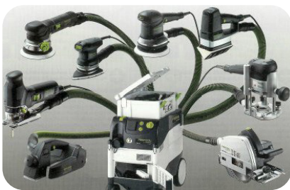
Industriële stofzuiger met aansluiting