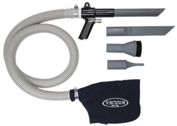
Hulpstukken van het zuigpistool

Als er perslucht aanwezig is kun je ook het zuigpistool toepassen op de werkplek om machines, het object of bewerkte materiaal te reinigen. Tevens kun je alle houtstof en zaagsel van de vloer zuigen met een hulpstuk.