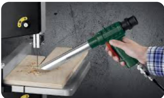
Zuigpistool voor reiniging machines en materiaal