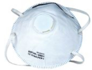
FFP3 "snuitje" met uitblaasventiel

Werkhandschoenen geven de huid extra bescherming tegen onder andere splinters bij manipulatie met hout en plaatmateriaal. Het dragen van handschoenen kan ook risico's met zich meebrengen. Dit is met name het geval bij het gebruik van houtbewerkingsmachines waarbij de handen tijdens de bewerking dicht bij het gereedschap komen. Hierbij ontstaat het risico van nagrijpen. Dit betekent dat je handschoen wordt gegrepen door het sneldraaiende gereedschap of beitelblok. De vingers en de hand worden in het gereedschap getrokken. Er ontstaan grotere verwondingen en een groter risico op een blijvende beperking van het betrokken lichaamsdeel.