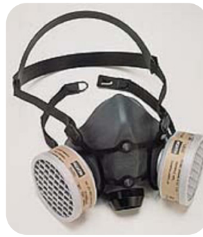
Filtermasker met P3-filters

Maskers behoren, net als veiligheidsschoenen, handschoenen en werkkleding, door één gebruiker te worden gedragen. Zorg er dus voor dat elke werknemer zijn eigen masker heeft. Ademhalingsbeschermingsmiddelen dien je stofvrij op te bergen in een goed afsluitbare verpakking, ook tijdens een pauze. Baarddragers hebben door een slechtere aansluiting op de huid minder goede bescherming tegen de blootstelling aan (hout)stof.