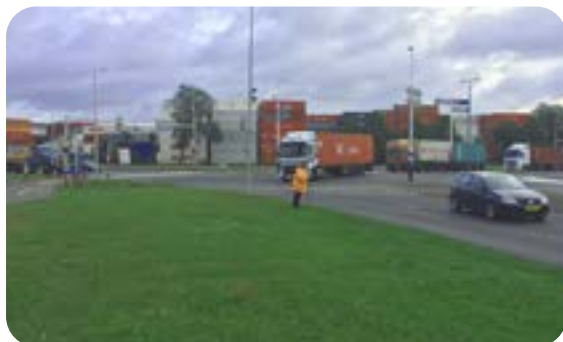
Figuur 1 | Werkzaamheden in de nabijheid van langsrijdend verkeer

Beroepen waarbij sprake kan zijn van blootstelling aan DME zijn onder andere: