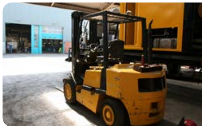
Figuur 2 | Een dieselaangedreven heftruck