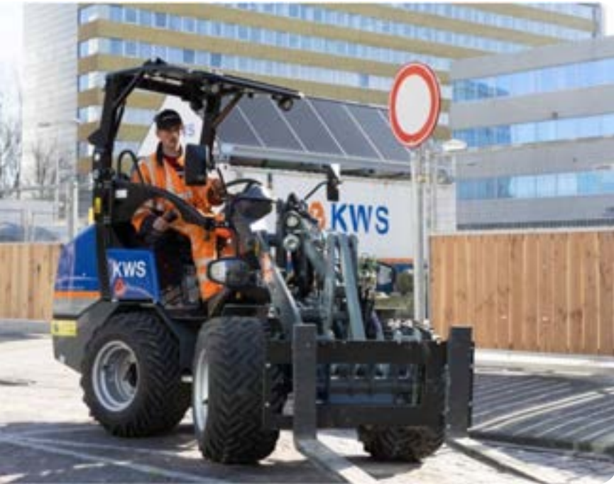
Figuur 8 | Voorbeeld van elektrisch kleinmaterieel: een elektrische shovel

Als er (nog steeds) blootstelling is aan DME, dan moeten organisatorische maatregelen genomen worden. Hieronder worden verschillende mogelijkheden genoemd. Ga per situatie na welke maatregelen mogelijk zijn. Pas maatregelen toe tot de blootstelling aan DME zo laag mogelijk is (minimalisatieplicht).