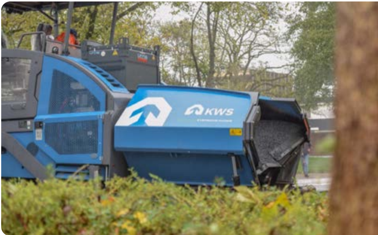
Figuur 3 | Een elektrische asfaltspreidmachine, voorbeeld van een non-road machine

Diesel aangedreven voertuigen of arbeidsmiddelen moeten worden vervangen of een bedrijf dient schriftelijk te kunnen onderbouwen waarom vervanging in een specifiek geval niet mogelijk is.