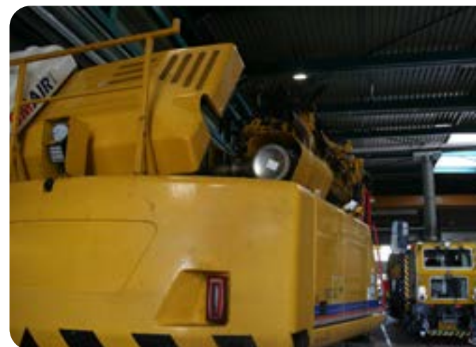
Figuur 7 | Kraan voorzien van een overdrukcabine, de filterunit is links op de foto zichtbaar

Om bescherming te bieden tegen dieselmotoremissies dienen door het filter van de overdrukcabine zowel deeltjes als gassen afgevangen te worden. Voor een juiste filtering van DME is een A2/P3 filter van belang. Bij het gebruik van cabines is het van belang ramen en deuren gesloten te houden. Om een prettige werkomgeving te garanderen is klimaatbeheersing nodig.