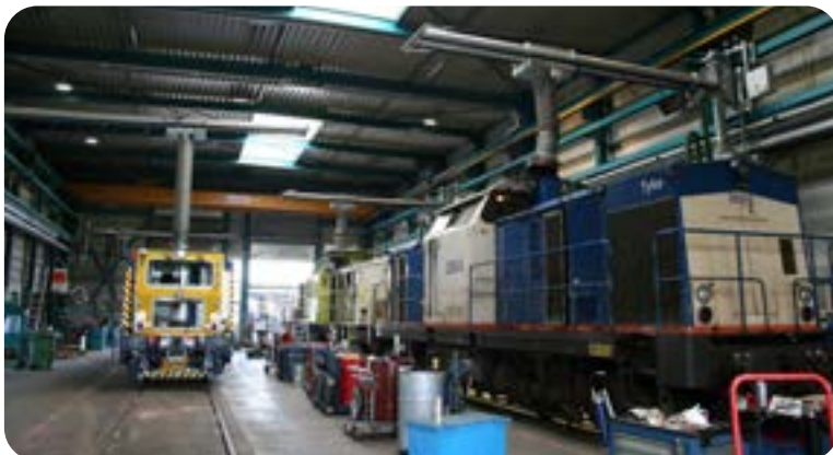
Figuur 6 | Puntafzuiging in een werkplaats

Voor besloten of afgesloten ruimten is het van belang om mobiele mechanische ventilatiesystemen in te zetten. Indien er reeds vaste ventilatie aanwezig is in een tunnel of in een hal kan ook deze ingezet worden. Het is van belang de benodigde capaciteit vooraf te bepalen: te veel capaciteit kost onnodig energie, te weinig is niet effectief. Tijdens een project kan met behulp van luchtkwaliteitsmetingen worden vastgesteld of de ventilatie voldoende is.