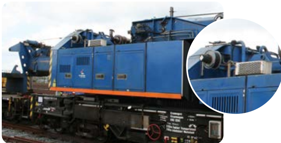
Figuur 5 | Een voorbeeld van materieel dat is voorzien van een roetfilter (zie inzet)

In een diesel partikel filter wordt roet opgevangen als de dieselmotoruitlaatgassen erdoor stromen. De hoeveelheid roet in het filter zal opbouwen en wordt verbrand bij ca. 600°C, waarbij het roet wordt omgezet in as. Gebruik van een katalysator verlaagt deze verbrandingstemperatuur waardoor roet effectiever verbrand wordt. Na verloop van tijd zit het filter vol met as. Het filter moet dan worden verwijderd en gereinigd.