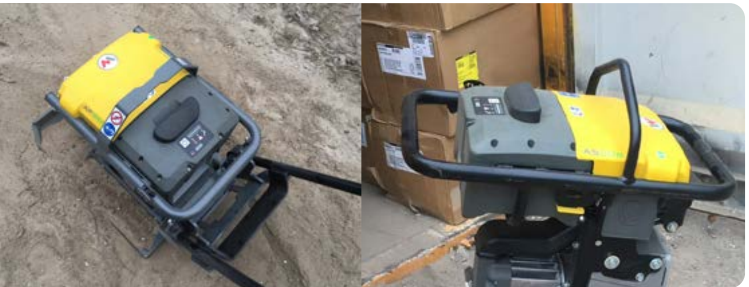
Figuur 4 | Een elektrisch aangedreven trilplaat (links) en een elektrisch aangedreven trilstamper (rechts).

Bij het introduceren van elektriciteit op de bouwplaats ontstaat een nieuwe realiteit met nieuwe risico's en uitdagingen. Accu's zijn zwaar en hebben effect op de stabiliteit van materieel. Het introduceren van accu's heeft impact op de brandveiligheid. Er zullen voorzorgsmaatregelen genomen dienen te worden voor de brandveiligheid, diefstal, opslag en transport. Tijdens het laden van accu's kunnen er magneetvelden ontstaan die bij voorgeschreven gebruik en onderhoud geen blootstelling hoger dan de blootstellingslimieten zullen geven. Op het gebied van elektrische veiligheid wordt kennis van de NEN3140:2011+A3:2019 (Bedrijfsvoering van elektrische installaties – laagspanning) en NEN 9140:2024 (Veilig werken aan e-voertuigen) van belang. Het werken met elektriciteit vraagt een andere cultuur, een andere planning en een andere voorbereiding op de bouwplaats. Meer informatie over dit onderwerp is te vinden in de Richtlijn veilige inzet elektrisch materieel van Bouwend Nederland - KOMAT .