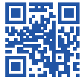
Scan de QR-code