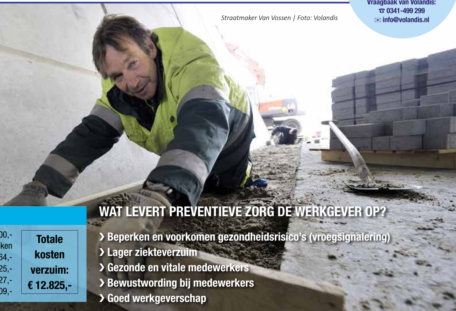
Straatmaker Van Vossen

Investeren in je medewerkers was nog nooit zo eenvoudig!