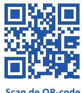
Scan de QR-code